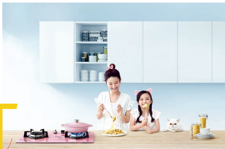
TGC x Hello Kitty 嵌入式平面爐設計可愛，讓一家大小同享入廚樂。