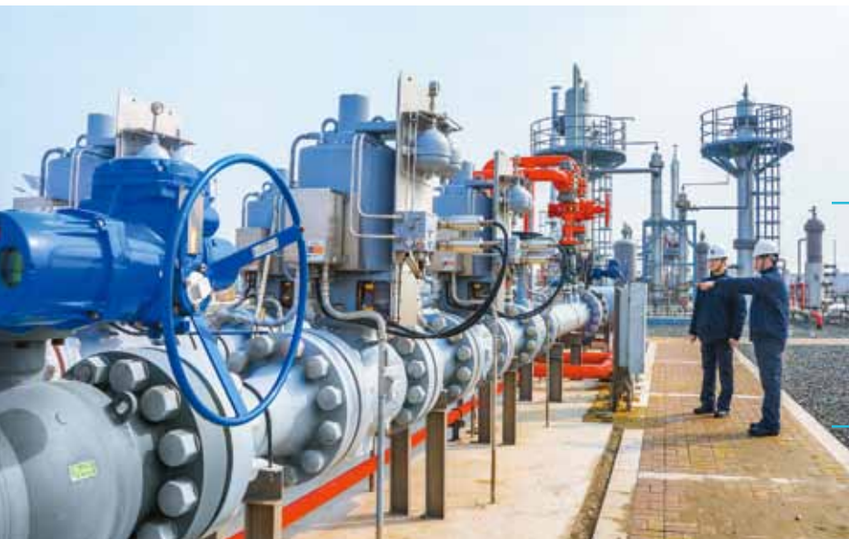
集團於江蘇省金壇區興建之天然氣地下儲氣庫，有助補充和調節華東地區用氣高峰期之供氣量。

集團內地水務業務發展迅速，旗下華衍水務有限公司（華衍水務）於內地共投資及營運六個水務項目，為江蘇及安徽兩個省份超過119萬用戶提供服務。集團之水務業務銷售總收入仍穩步上升3%，銷售量達4.55億噸。我們並在年內將水務業務擴展至樓宇供水系統維修服務，進一步提升全年總收入。